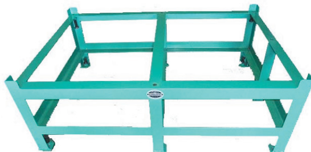
形状 II Shape II