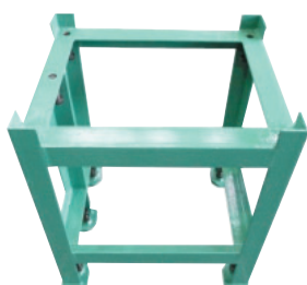
形状 I Shape I

○…支持点 ×…補助点 ○…Support point X…Auxiliary point