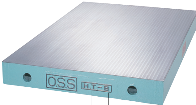
▲ 段無しタイプ Non-step type