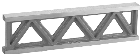
●OS-143 精度・寸法・定価表