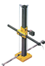
レイアウトマシン(参考画像)