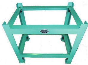
形状 I Shape I