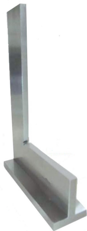
STAINLESS-STEEL SQUARE WITH A FLAT BASE