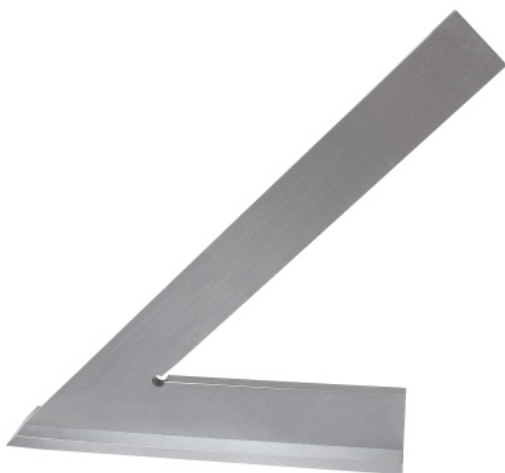
45° ANGLED SCALE WITH A BASE